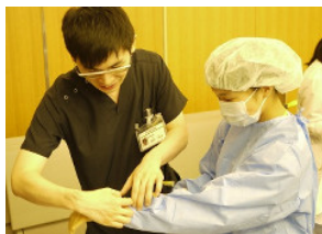
ガウンテクニック