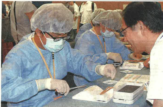
医師(右)の指導で外科手術の縫合を体験する生徒―長浜市大塚交町・市立長浜病院