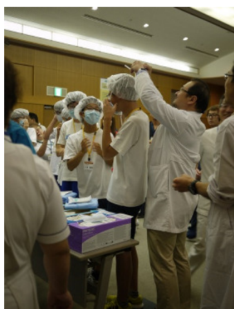
ガウンテクニック