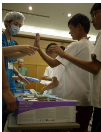
ガウンテクニック